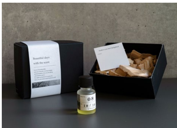
アロマブレンド完成イメージ