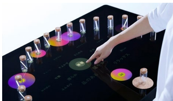
香りと言葉の変換システム「KAORIUM」のコンセプトモデル

https://www.a.u-tokyo.ac.jp/topics/topics_20190322-1.html