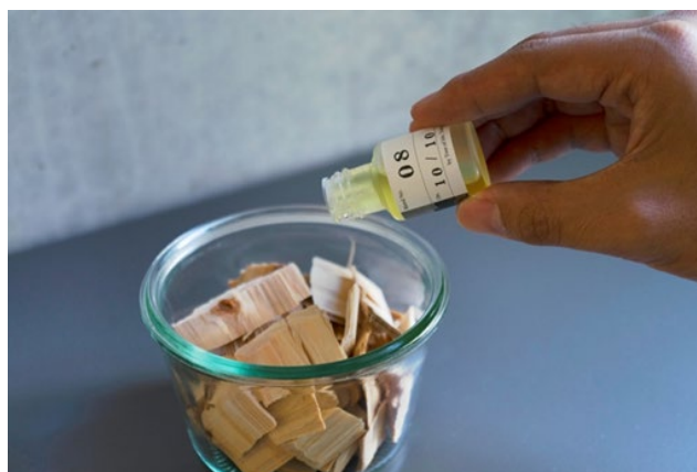
アロマウッドチップ使用イメージ